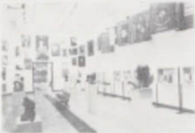
II. 9. Ekspozycja muzeów Biblioteki Narodowej: karty, książki i rękopisy z muzeów Łowicza.