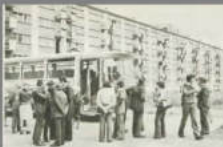
Jeżeli i grup zespoła osiedle Bródno