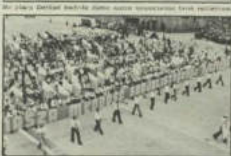
Wschodząca słońcem polska