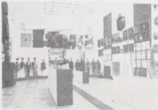
II. 7. Ekspozycja muzeów historycznych i historyczno-wojskowych.