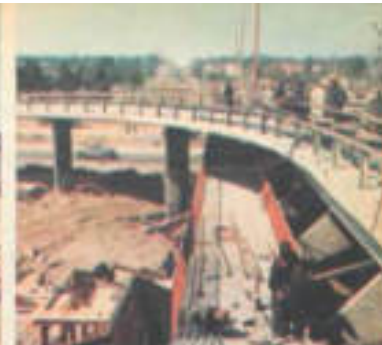
Składowisko drewna i Trasa Łazienkowska