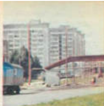
Widok na mosty nad ul. Cieszkowską

W 1971 r. powstanie kolejnej przesyłki, łączącej Wisłocice z centrum miasta. Wskazana tutaj jest droga i bieżący kierunek jej rozwoju wzdłuż Wisły.