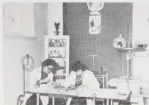
II. 14. Praca nad konserwacją papieru.