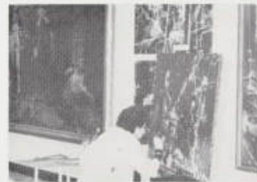
II. 12. Fragment skąpczej konserwatorskiej — demonstrowanie punktowemu ubytkowi walcem 2220-igłowym w czasie wyprawy.