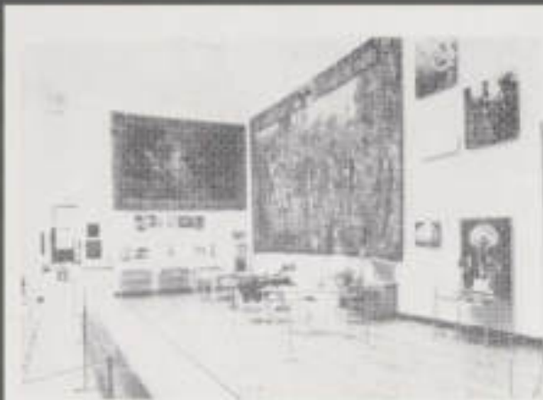
II. 13. Konserwacja tkanin.