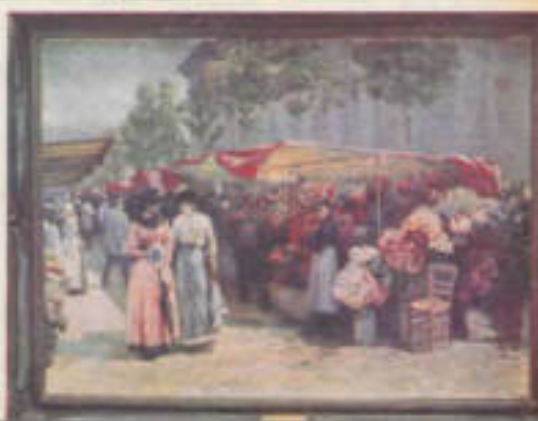
"Przekrój" 30 VI 1974, nr 26 (1386)