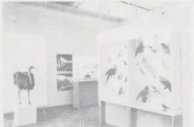
Il. 5. Fragment ekspozycji muzeum zoologicznego.