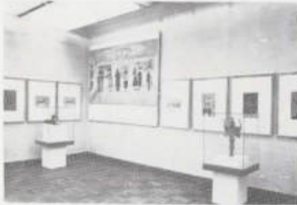
Il. 19. Fragment ekspozycji poświęconej działalności ulwiałowicej — prace piątkowe dzieci.