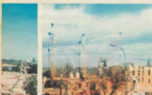
Widok na mosty nad Wisłą, wzdłuż Trasy Łazienkowskiej i Karłowicza

Widok z lotniska wzdłuż Wisły, mosty i Trasa Łazienkowska, planeta ul. Śmiały, Trasa Łazienkowska, mosty i ul.