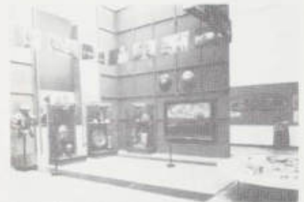
Il. 23. Ekspozycja Państwowych Zbiorów Sztuki na Wawelu