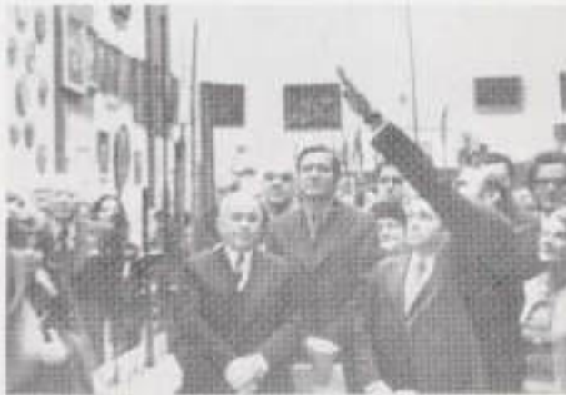
II. 8. Sala muzeów historycznych i historyczno-wojskowych w dniu otwarcia