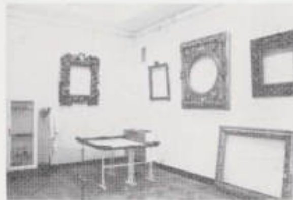
II. 16. Konserwacja ram.