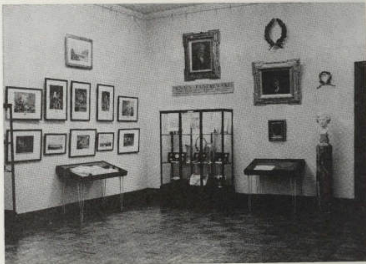
32. Społeczeństwo awemu Muzeum, 1968

"Rocznik Muzeum Narodowego w Warszawie" 1976, r. XX, s. 480