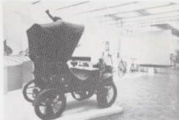
Il. 6. Ekspozycja muzeum techniki i nauki.

"Biuletyn Historii Sztuki" 1975/4, s. 366-373