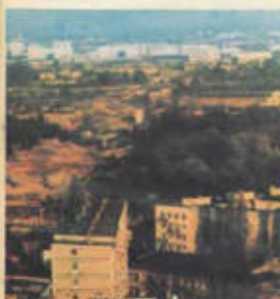
Moskiewska i Karłowicza