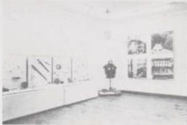
Il. 4. Ekspozycja archeologiczna — czasy średnio-wieczne.