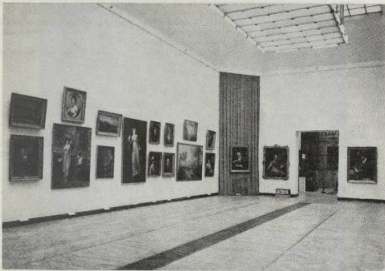
37. Muzea — Społeczeństwu, 1974

"Rocznik Muzeum Narodowego w Warszawie" 1976, r. XX, s. 493