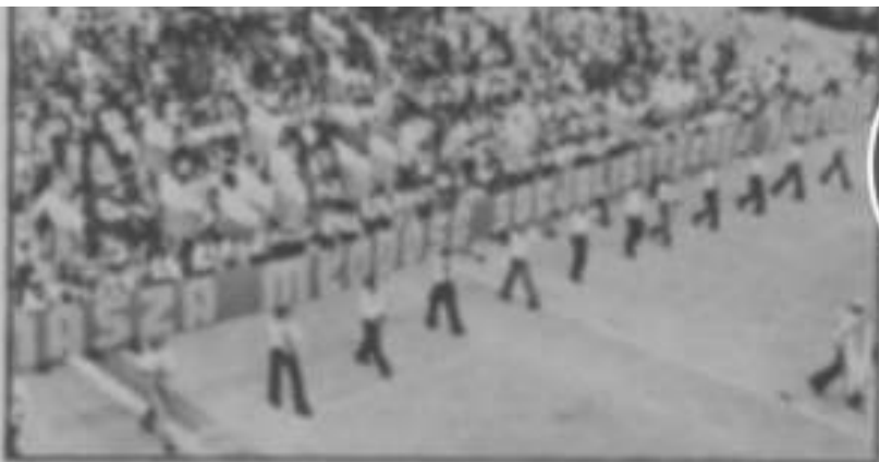
Manifestacja młodzieży polskiej.