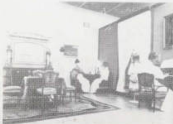
Il. 21. Wystawa „Zbiory muzealne Mazowiec” — ekspozycja sztuki secesyjnej