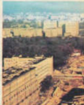
Planeta ul. Śmiały, Trasa Łazienkowska, mosty i ul.