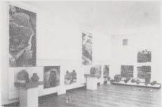
Il. 3. Ekspozycja archeologiczna — czasy prehistoryczne.