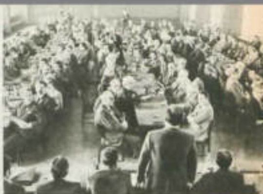
Wyjątkowy spotkanie na sali ulbrac.