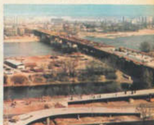
Most Łazienkowski nad Wisłą i Trasa Łazienkowska