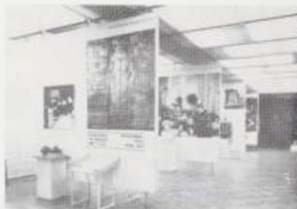
Il. 20. Ekspozycja poświęcona działalności obywatelce.