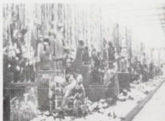
Il. 22. Wystawa „Zbiory muzealne Mazowiec” — ekspozycja sztuki ludowej