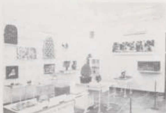
II. 15. Konserwacja sztuki starocytnej.