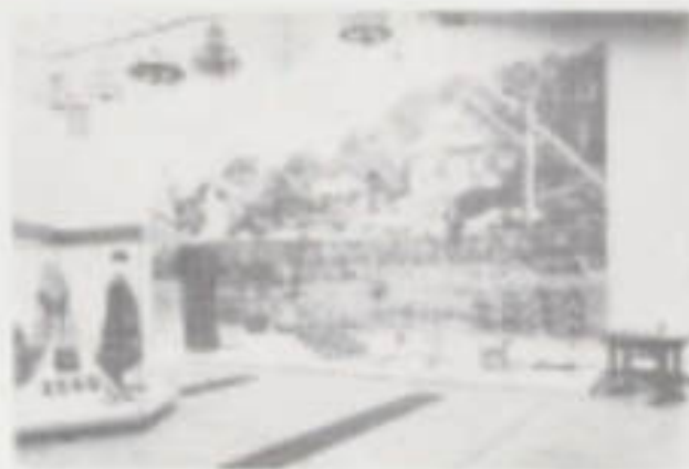
II. 10. Fragmenty ekspozycji etnograficznej.

"Biuletyn Historii Sztuki" 1975/4, s. 366-373