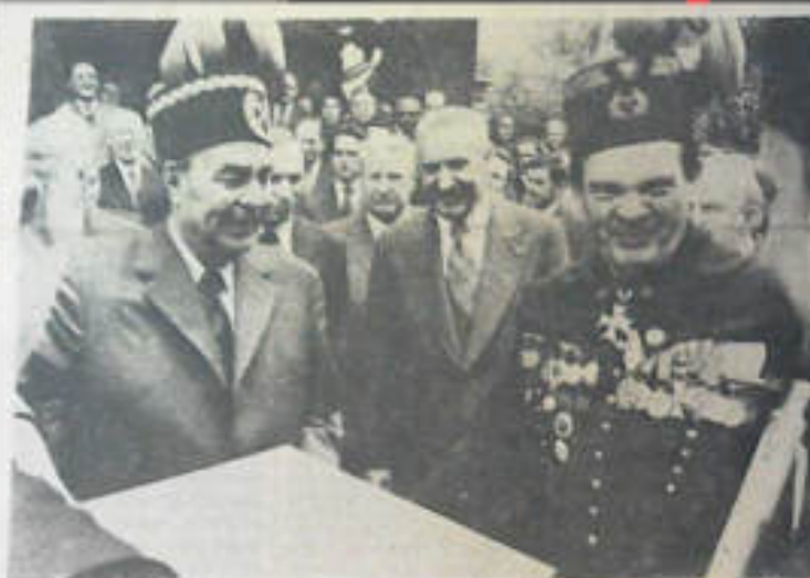
Leonid Breżniew wstrzymuje Józefa górnika

Owocni byli również ambasadorowie ZSRR w Polsce.